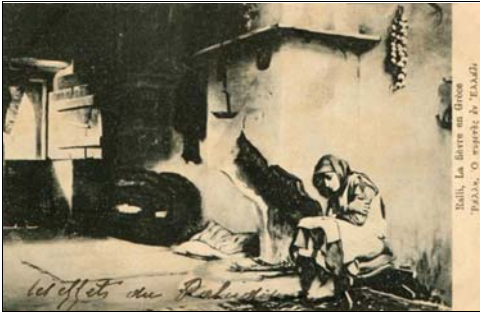
Balk, La fièvre au Maroc F. P. 219, O. 219, 18

Cancel: unused Issue Date: c. 1920 Printer: Image: malaria victim Notes: text: The fever in Greece; mailer's added script: The effects of malaria ; image of reverse not available Price: E